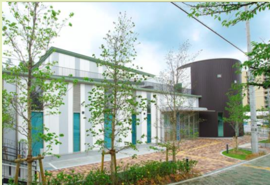
京阪バス「新香里園」下車徒歩2分